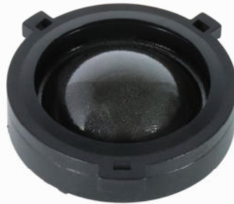
HS24 VW EVO2