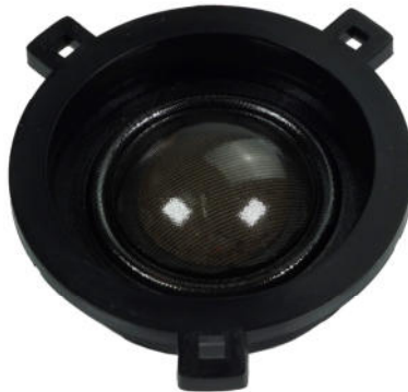
HS24 GOLF 6+7 EVO2