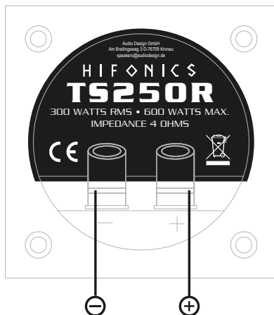
Lautsprecherausgänge Verstärker 4 Ohm

Achten Sie bei dem Anschluss der Kabel unbedingt auf die korrekte Polung.