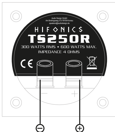
Loudspeaker Outputs Amplifier 4 Ohms

Please ensure that the connection of the cables have the correct polarity.